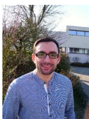
Nabi Kavak Mathematik